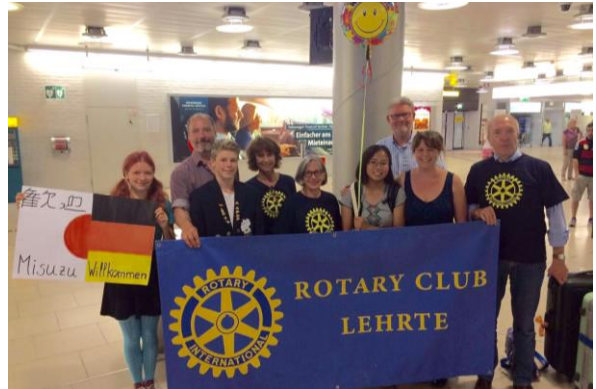
(当地でホストファミリー等から歓迎を受けました)